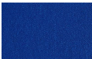
A 13 ELECTRIQUE