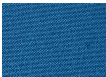
A 168 GLACIER