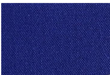
A 116 BLEU NOCTURNE