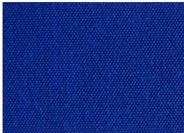
A 115 BLEU ROYAL