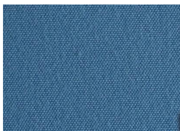
A 12 CIEL