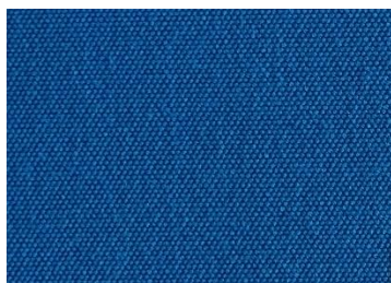
A 14 BLEU CARAIBES