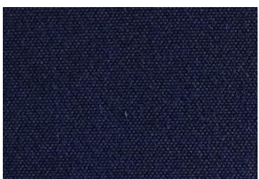
A 19 BLEU NAVY