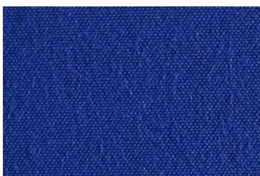
A 114 BLEU BUGATTI