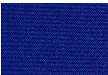
A 20 BLEU FONCÉ